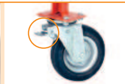
Deux roues munies d'un système de blocage