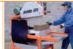
Châssis robuste doté de 4 roues