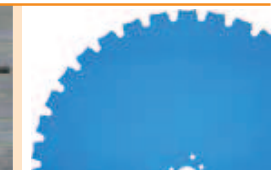
Nous recommandons l'utilisation des disques diamant Norton Pro BS-12