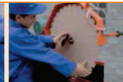
Accès aisé au disque